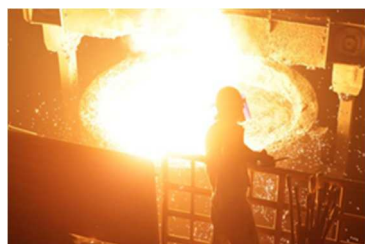
鉄スクラップ溶融工程

三井住友銀行では、「SDGs推進融資」により、本業を通じ、SDGsが達成される社会の実現に貢献をしております。